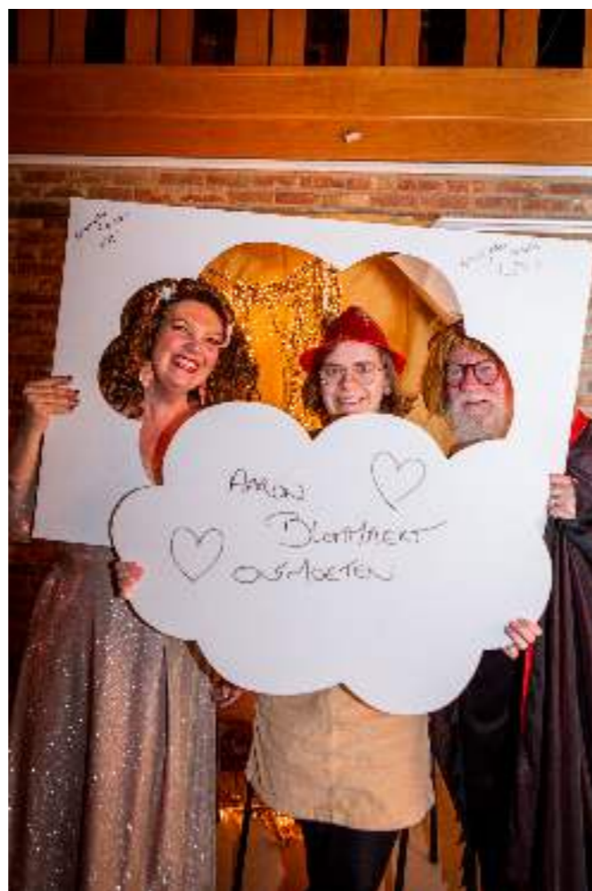
Doorheen dit Zonnemagazine tonen we foto's van onze nieuwjaarsrecepties. Geniet mee van deze gezellige momenten!